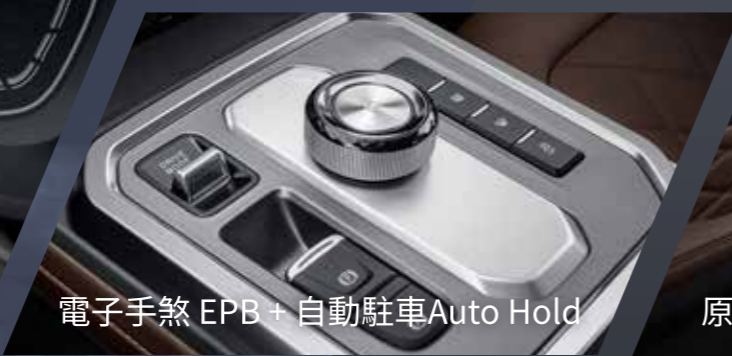
電子手煞 EPB + 自動駐車Auto Hold