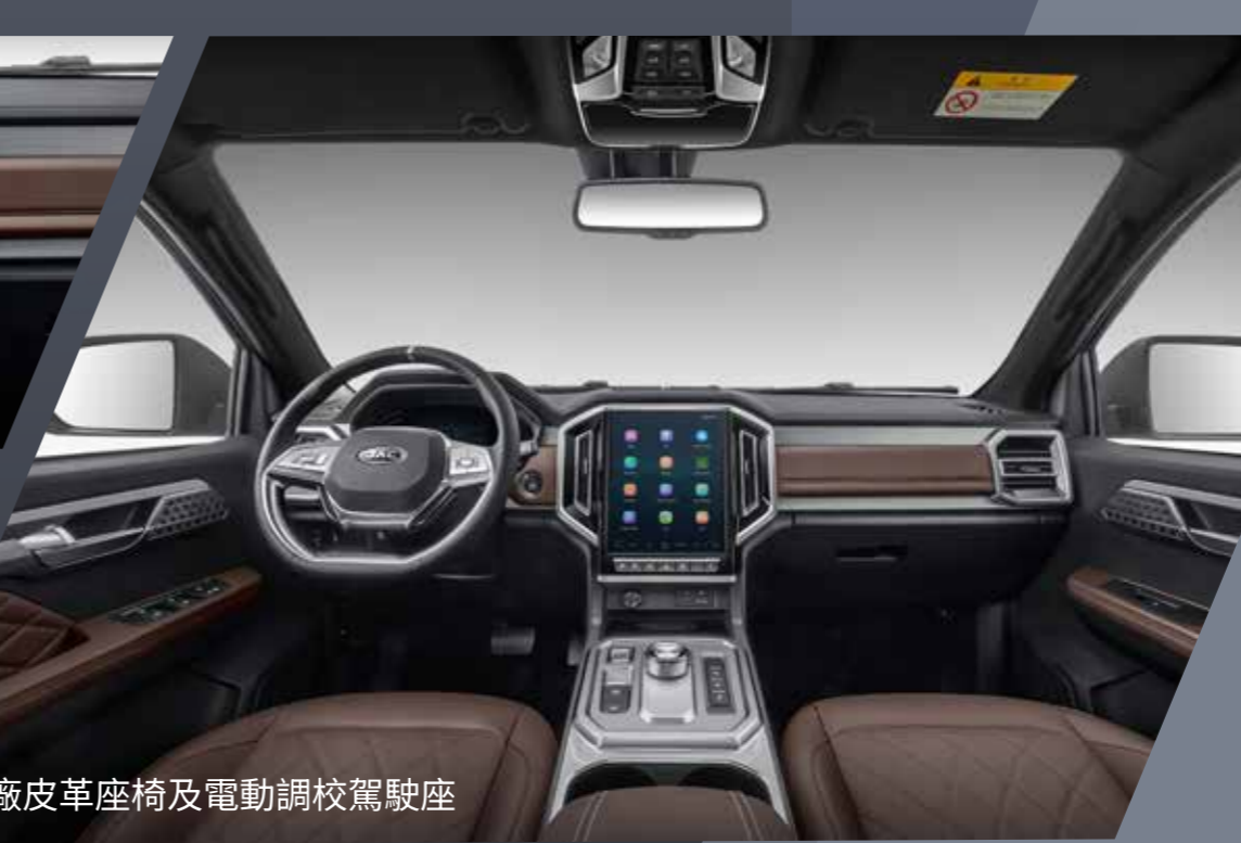
原廠皮革座椅及電動調校駕駛座