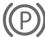
電子手煞 + 自動駐車 EPB + Auto hold